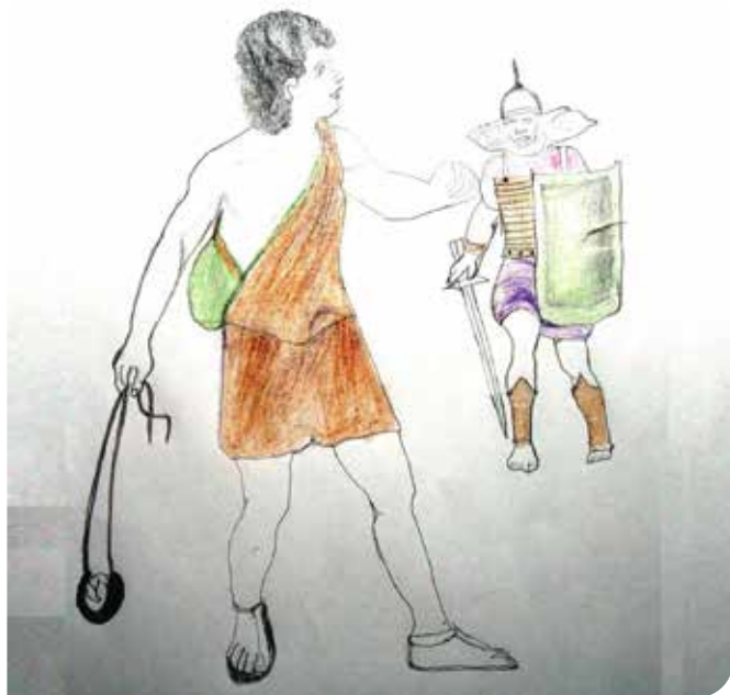
David en Goliath (1 Samuel 17).