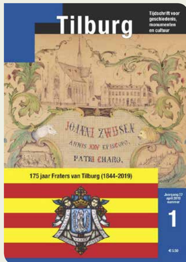
Tilburg. Tijdschrift voor geschiedenis, monumenten en cultuur. Jaargang 37, april 2019, nr. 1.

Losse nummers zijn verkrijgbaar in de Tilburgse boekhandels (à €5,50).