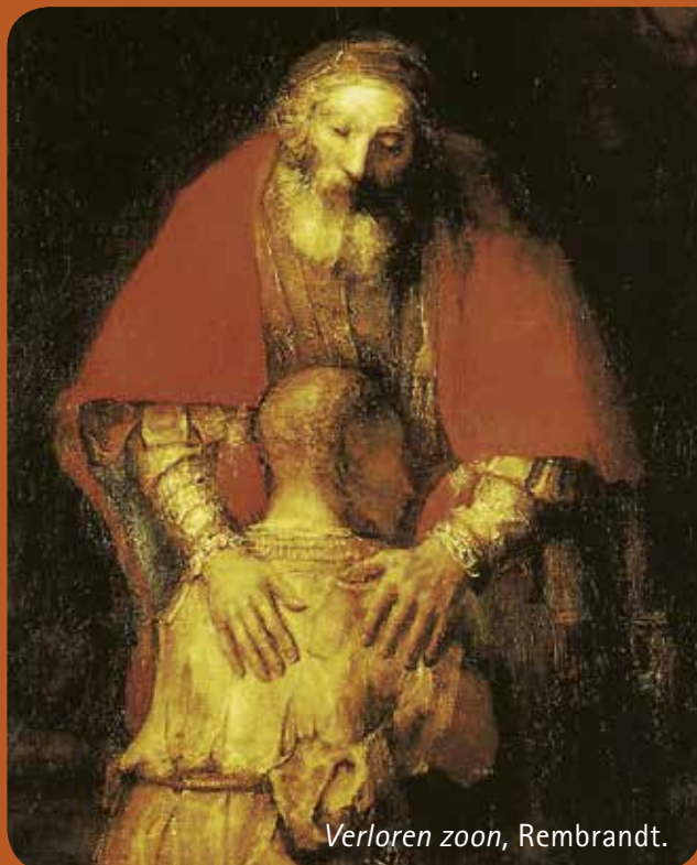
Verloren zoon, Rembrandt.

De Congregatie van de Fraters van Onze Lieve Vrouw, Moeder van Barmhartigheid is geworteld in de christelijke barmhartigheid.