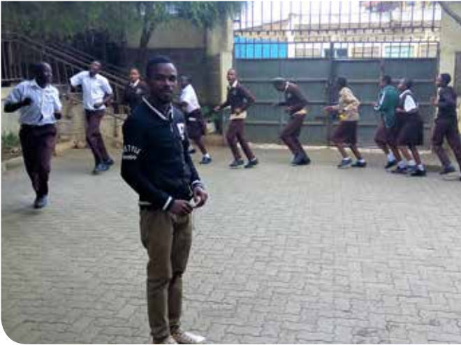
Een oefening van scouts op het schoolplein.