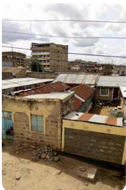
De wijk 'Soweto' in Nairobi-Umoja.