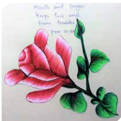
"Wie zijn tong in toom houdt..." (Spreuken 21:23).