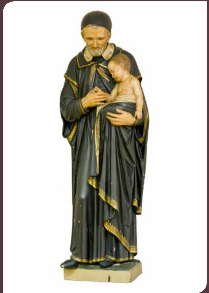
Beeld van Vincent de Paul in het Generaalat van de fraters.

Zwijsens bewondering voor Vincentius sloot dus aan bij de geest van de tijd. Hij ging wel verder dan veel anderen in zijn navolging van de Franse heilige. Niet voor niets werd hij in 1842, bij zijn bisschopswijding, door enkele goede Tilburgse vrienden met een mengeling van bewondering en plagerij als 'de Vincentius van Tilburg' aangeduid. De aandacht voor de heilige Vincentius was voor Zwijsen echter