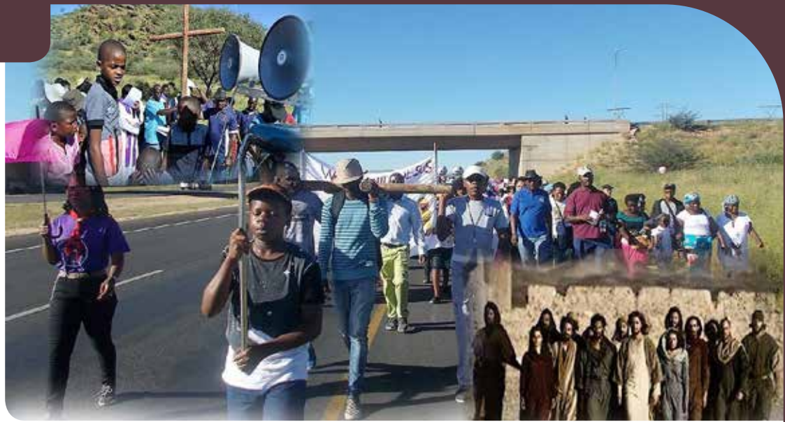
Fotocollage 'Walk with Christ'.