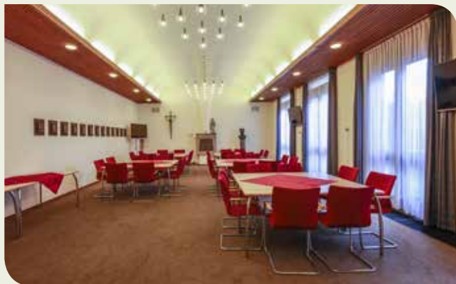
De kapittelzaal in het Generaalaat van de Fraters CMM te Tilburg.

Van maandag 18 mei tot en met vrijdag 5 juni 2020 zal het volgende generaal kapittel worden gehouden, in het generaalaat van de Fraters CMM in Tilburg.