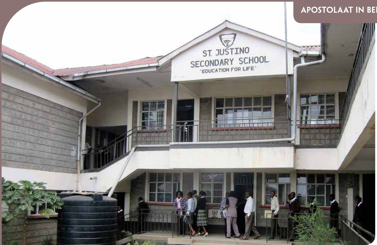
Hoofdingang van de school.