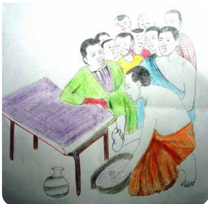
Jezus wast de voeten van zijn leerlingen (Johannes 13,3-5).