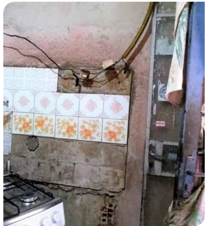
Keukenblok in een favela in Brazilië.

Samen met enkele leden van de SSVP ( São Vicente de Paulo Society , de Vincentiusvereniging in Brazilië) bezochten de fraters enkele gezinnen om de situatie in kaart te brengen: de moeilijkheden, de financiële problemen, de uitdagingen waar ze dagelijks mee te maken hebben. Gebaseerd op de resultaten van dit onderzoek wordt nu bekeken hoe de meest schrijnende gevallen het best kunnen worden geholpen.