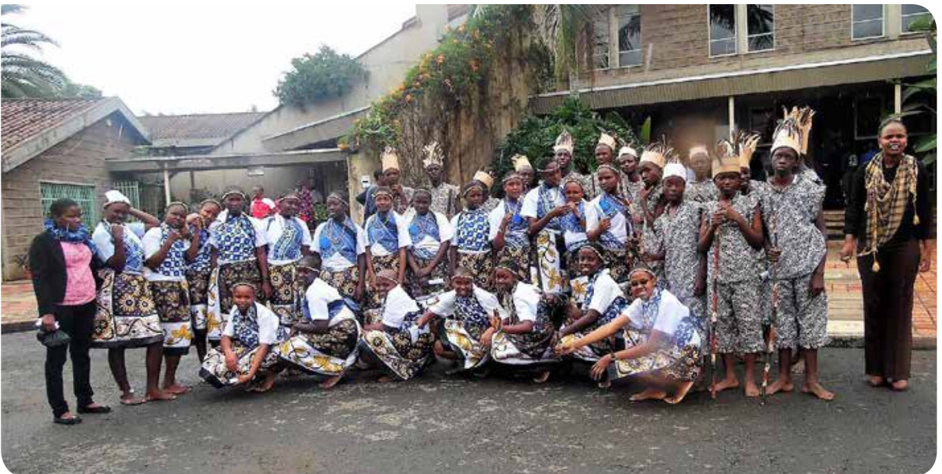
St. Justino's team voor een muziekfestival in 2016.