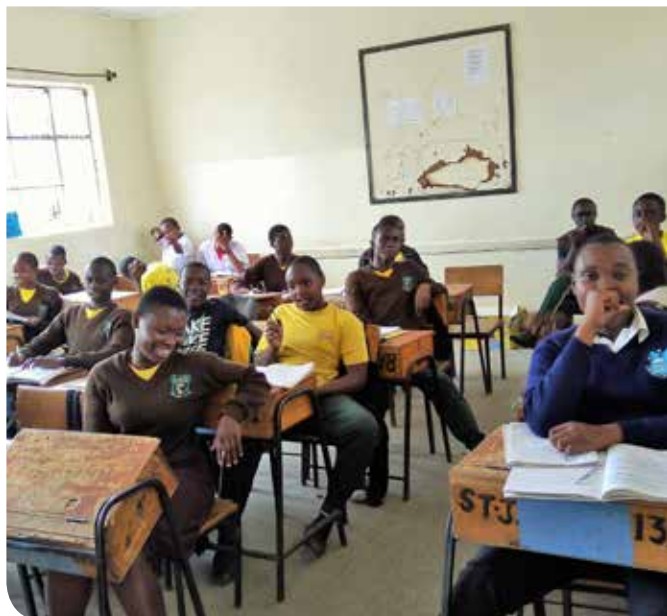
Leerlingen van St. Justino.