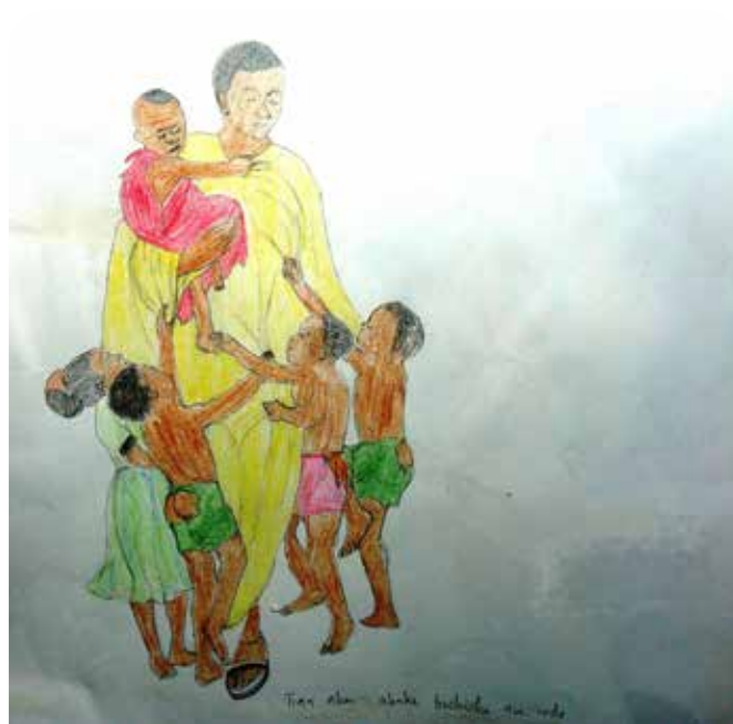
"Laat de kinderen tot mij komen" (Lucas 18,16; Marcus 10,14; Matteus 19,14).