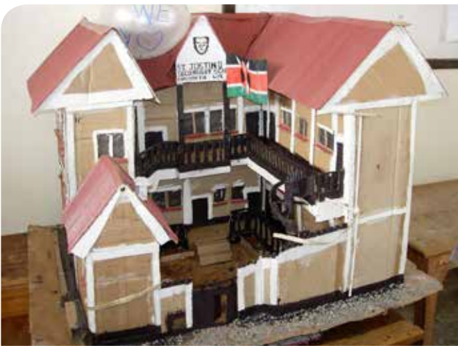
Maquette van het schoolgebouw.