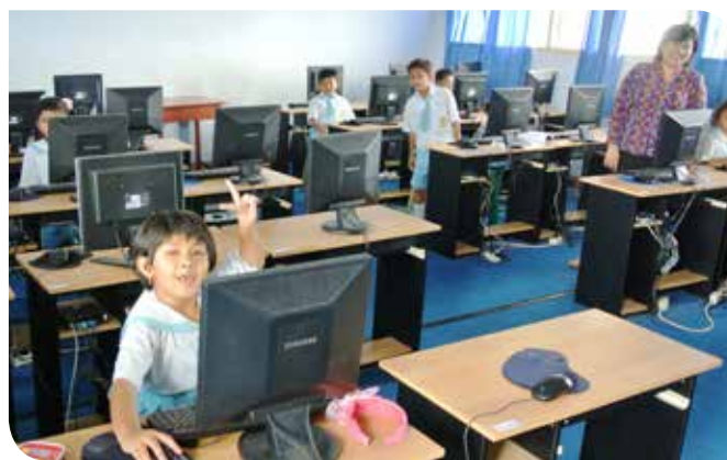
Leerlingen in het computerlokaal, Frater Don Bosco School Tarakan.

Ten eerste moeten we erkennen dat het internet een gegeven is; het heeft geen zin om het gebruik ervan te verbieden of te beperken. Van ons als fraters wordt verwacht dat we kinderen leren hoe ze goed gebruik kunnen maken van digitale media en andere informatietechnologie. We kunnen onze studenten