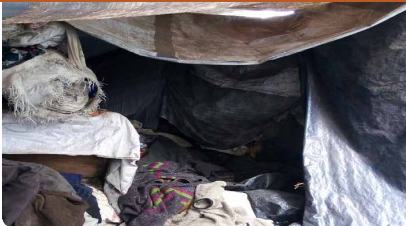
Restanten van het afgebrande 'huis' in de sloppenwijk Huruma, Kenia.