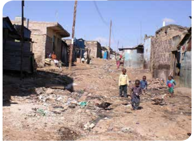
Straat in de wijk Soweto in Nairobi-Umoja.